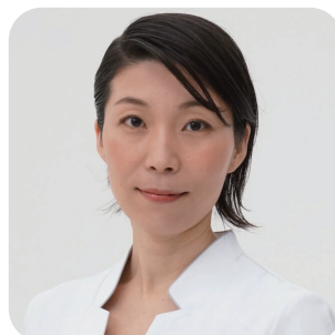
基調講演 桐村里紗 医師

新たな学術分野や企業活動で注目されているプラネタリーヘルス(人と地球の健康)の実践の場として鳥取県江府町当局と連携し無農薬・無施肥・不耕起の協生農法を試行。「圃内の土壌改良にもなる食の選択」を唱える地域創生医。