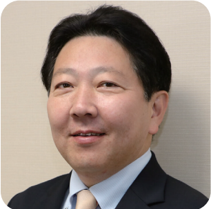
特別講演 酒井 直人 中野区長

健常者には自らの日常的な健康状態と生活習慣のチェックを促し、一方、高リスクの生活者には疾病の早期発見と適切な受診勧奨、重篤化させない環境を整えるためには、セルフチェックが決定的に重要。昨年11月に再スタートしたセルフチェック部会の井手部会長から機器、検査キット、疾患管理アプリ等の条件整備の方向を学ぶ。